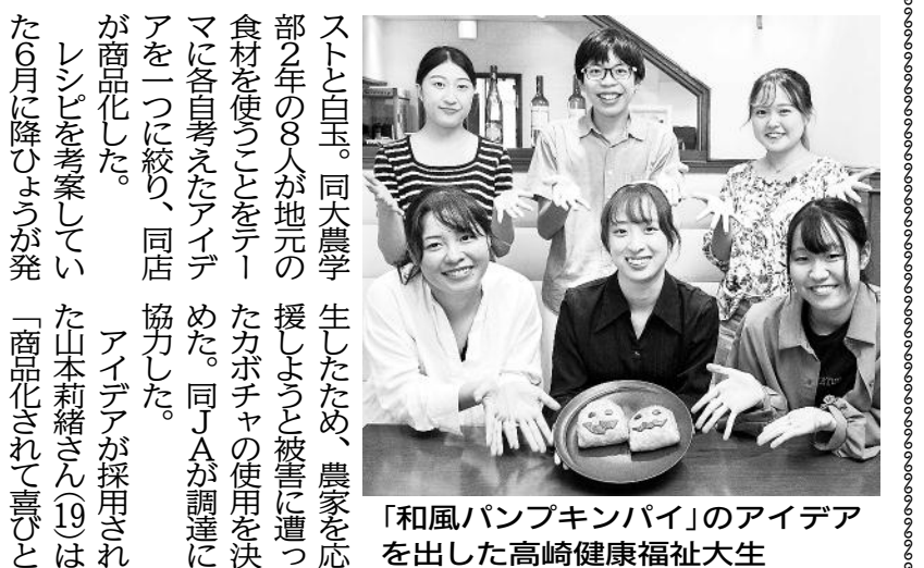
「和風パンキンパイ」のアイデアを出した高崎健康福祉大生

ストと白玉。同大農学部2年の8人が地元産の食材を使うことをテーマに各自考えたアイデアを一つに絞り、同店が商品化した。