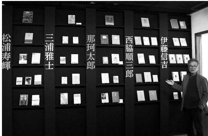
30日に開かれた内覧会で前橋文学館の企画展を紹介する萩原館長